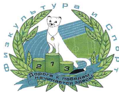
ГРАФИК ПРИЁМА ИСПЫТАНИЙ ВФСК «ГТО»